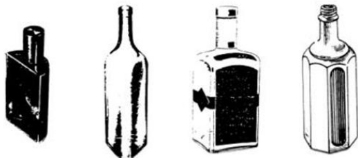
19.7.2 Bouteilles ou flacons de section horizontale autre que circulaire ou elliptique